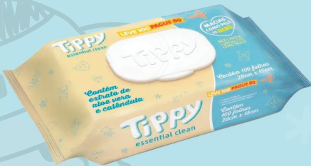
Toalha Umedecida Tippy c/ 100un R$ 9,99 UND