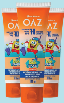
Protetor Solar Bob Esponja OAZ Eurofarma c/ 125ml R$ 54,90 UND