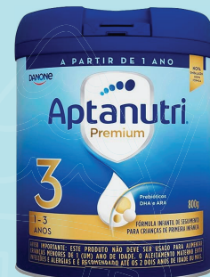
Leite Aptanutri Premium 3 c/ 800g Leve 2 ou + R$ 47,99 Cada R$ 54,99 UND

O ministério da saúde informa: o aleitamento materno evita infecções e alergias e é recomendado até os dois anos de idade ou mais.