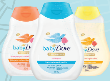
Shampoo de Glicerina BabyDove c/ 200ml R$ 14,99 UND