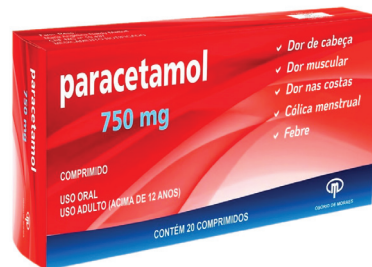
Paracetamol 750mg c/ 20 comp. R$ 4,99 UND