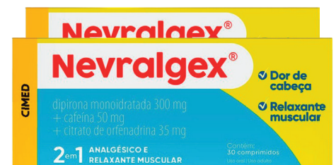
Nevralgex 2 em 1 c/ 30 comp. R$ 16,99 UND