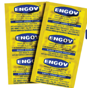
Engov c/ 3 cartelas Leve 2 ou + R$ 7,99 Cada R$ 9,86 UND