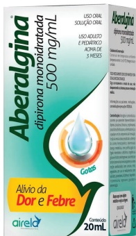
Dipirona 500mg/ml Aberalgina c/ 20ml Leve 2 ou + R$ 3,99 Cada R$ 6,99 UND

O ministério da saúde informa: o aleitamento materno evita infecções e alergias e é recomendado até os dois anos de idade ou mais.