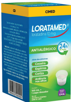
Antialérgico Loratamed c/ 100ml + copo Dosador R$ 18,99 UND