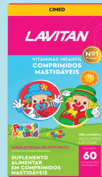
Suplemento Alimentar Lavitan c/ 60 cáps. R$ 29,90 UND