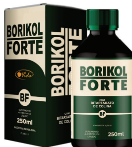
Borikol Forte c/ 250ml R$ 39,90 UND